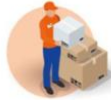
POSTAL OPERATORS INSIDE AND OUTSIDE THE EU